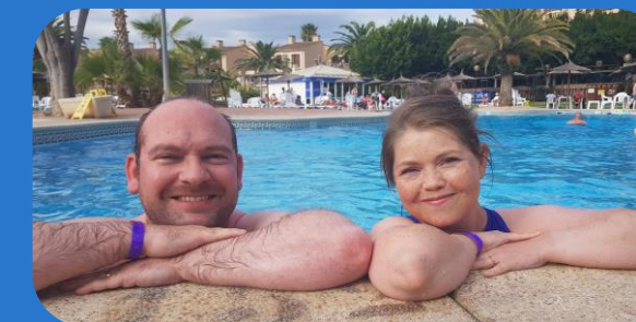
Viðgerðir í ferihýri