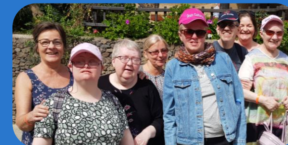
Upplivingar fyri øll