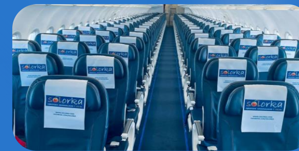
Úr Vágum í Vágar