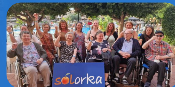
Lívsgleði uttan aldur