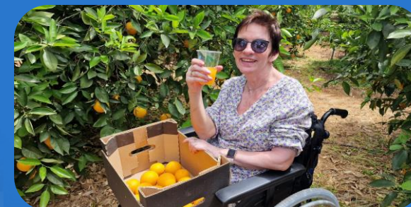
Orka og vælvera