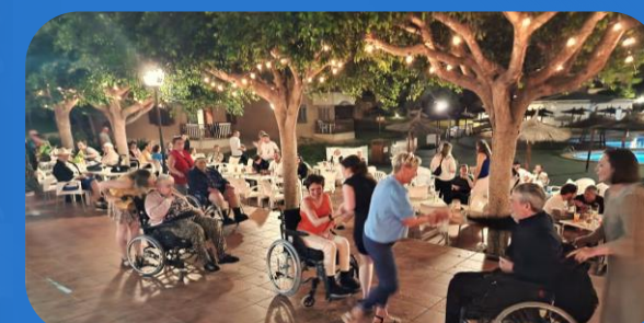
Stuðul hjá stuðlinum