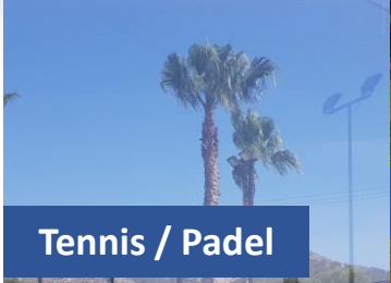
Tennis / Padel

Vit skipa eisini fyri 'multi-sport' -skráum, har tað ber til at taka lut í hálvdags-skeiðum innan nógvar ymiskar ítróttagreinar.