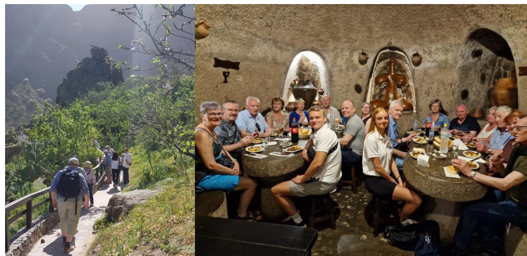
Holubúgvaradalurin og miðmáli í hellinum