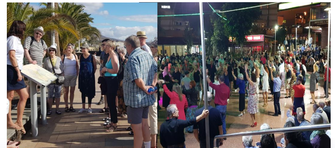
Hugnaligar løtur við gongutúrum og felagsdansi