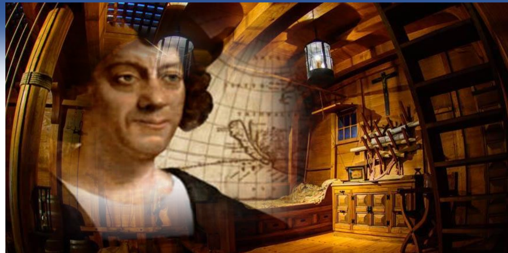
Húsini, har Kolumbus fyrireikaði ferðir sínar vestur um hav