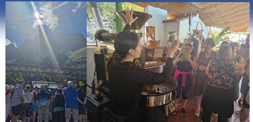
Eksotiska kaffiplantasjan í vakra Agaete-dalinum