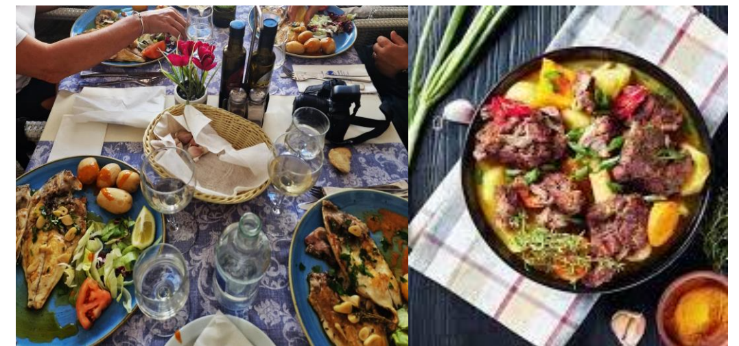
Frálíki fiskurin og grýtan við geitakjøti