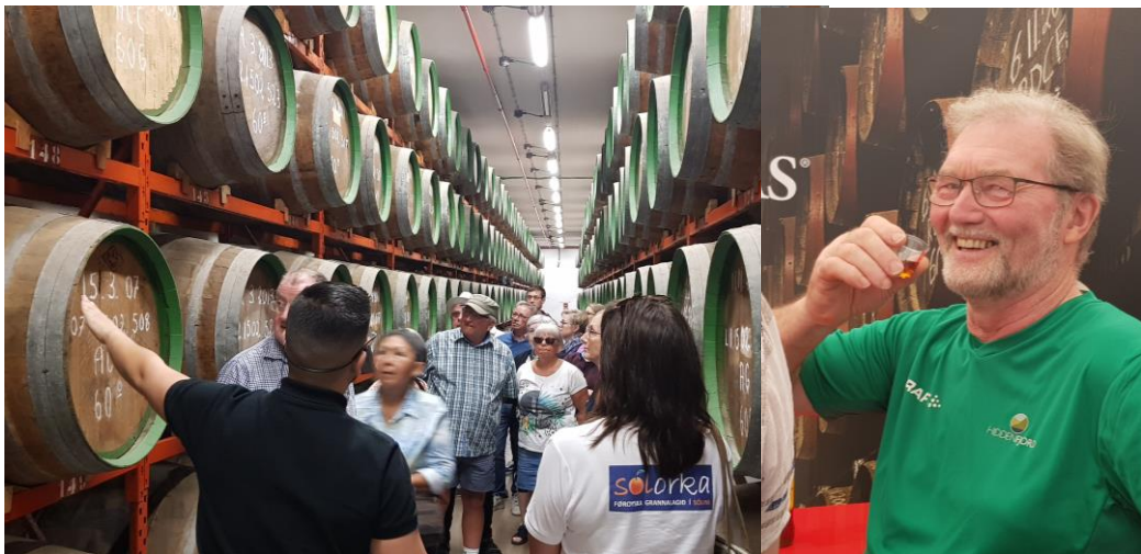
Rommbrennarið og rommsmakking