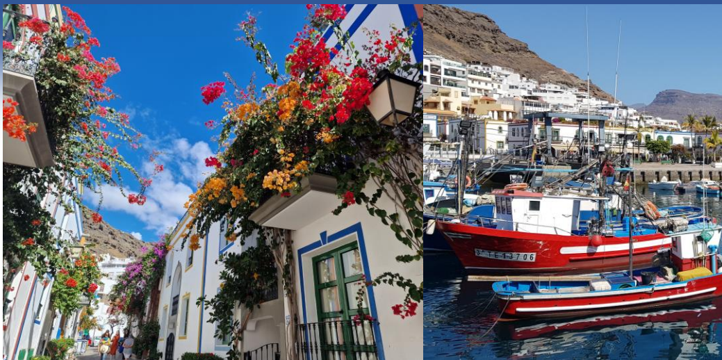
Puerto de Mogán og aðrar vakrar bygdir