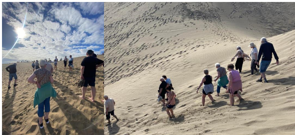
Oyðimarkarferð í sandheggjunum i Maspalomas